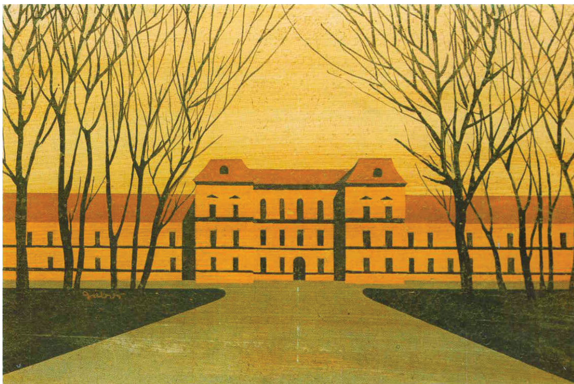
SLIKA 1. Razglednica Psihijatrijske bolnice Vrapče, prednja strana FIGURE 1. The postcard of the Psychiatric Hospital Vrapče, front